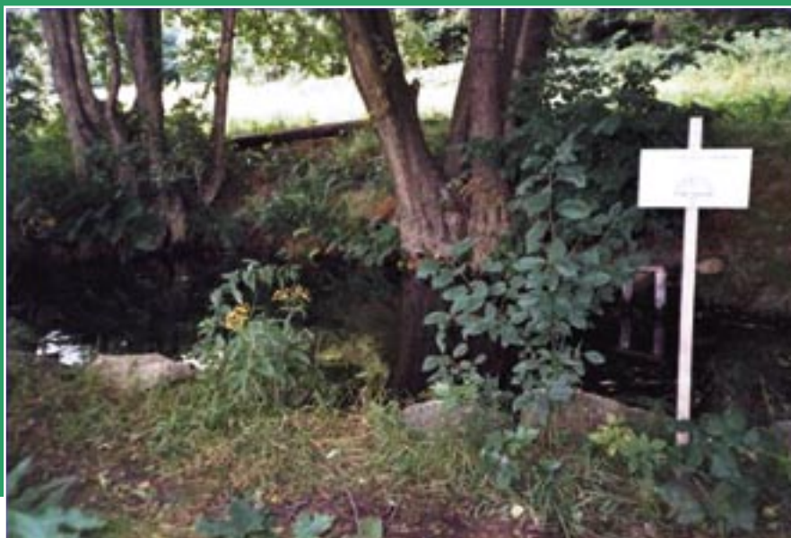
Pramen řeky Jihlavy